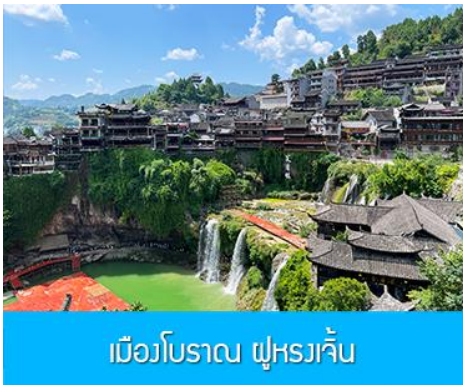
เมืองโบราณ ฝูหรงเจิน

จากนั้นนำท่านเดินทางสู่เมืองฝูหรงเจิน นำท่านเที่ยวชม เมืองโบราณ ฝูหรงเจิน 芙蓉古镇 เมืองโบราณเก่าแก่ขึ้นชื่อของมณฑลหูหนานที่โด่งดังจาก ภาพยนตร์เรื่อง ฝูหรงเจิน เป็นสถานที่ท่องเที่ยวระดับ 4A ที่ได้รับความนิยมจากนักท่องเที่ยวคู่กับเมืองโบราณฟงหวง เป็นสถานที่หลักในการถ่ายทำภาพยนตร์เรื่อง ฝูหรงเจิน ทำให้สถานที่แห่งนี้ยังได้รับความนิยมจากนักท่องเที่ยว จุดไฮไลท์ของเมืองโบราณแห่งนี้ นอกจากบ้านเรือนโบราณสวยเก๋ที่เป็นเอกลักษณ์เฉพาะของมณฑลหูหนาน ที่นี่ยังมีน้ำตกขนาดใหญ่ที่สวยงามกลางเมืองที่เป็นจุดเช็คอิน