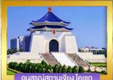
อนุสรณ์สถานเจียง ไคเชก