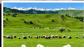
ทุ่งหญ้าานาลาตี