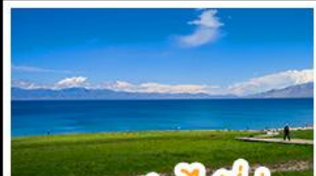
ทะเลสาบไซลีมู

หุบเขาดอกท้อ - ทะเลสาบไซลีมู แกรนด์แคนยอนตู่ชานจื่อ - ทุ่งหญ้าานาลาตี