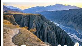
แกรนด์แคนยอนตู่ชานจื่อ