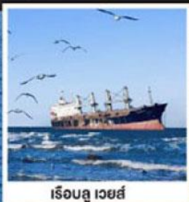
เรือลู เวย์ส์