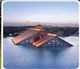
พิพิธภัณฑ์ไดน้ำ กวางฟู่หลิน