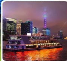
ล่องเรือแม่น้ำหวงผู่