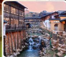
เมืองโบราณเหยาหู