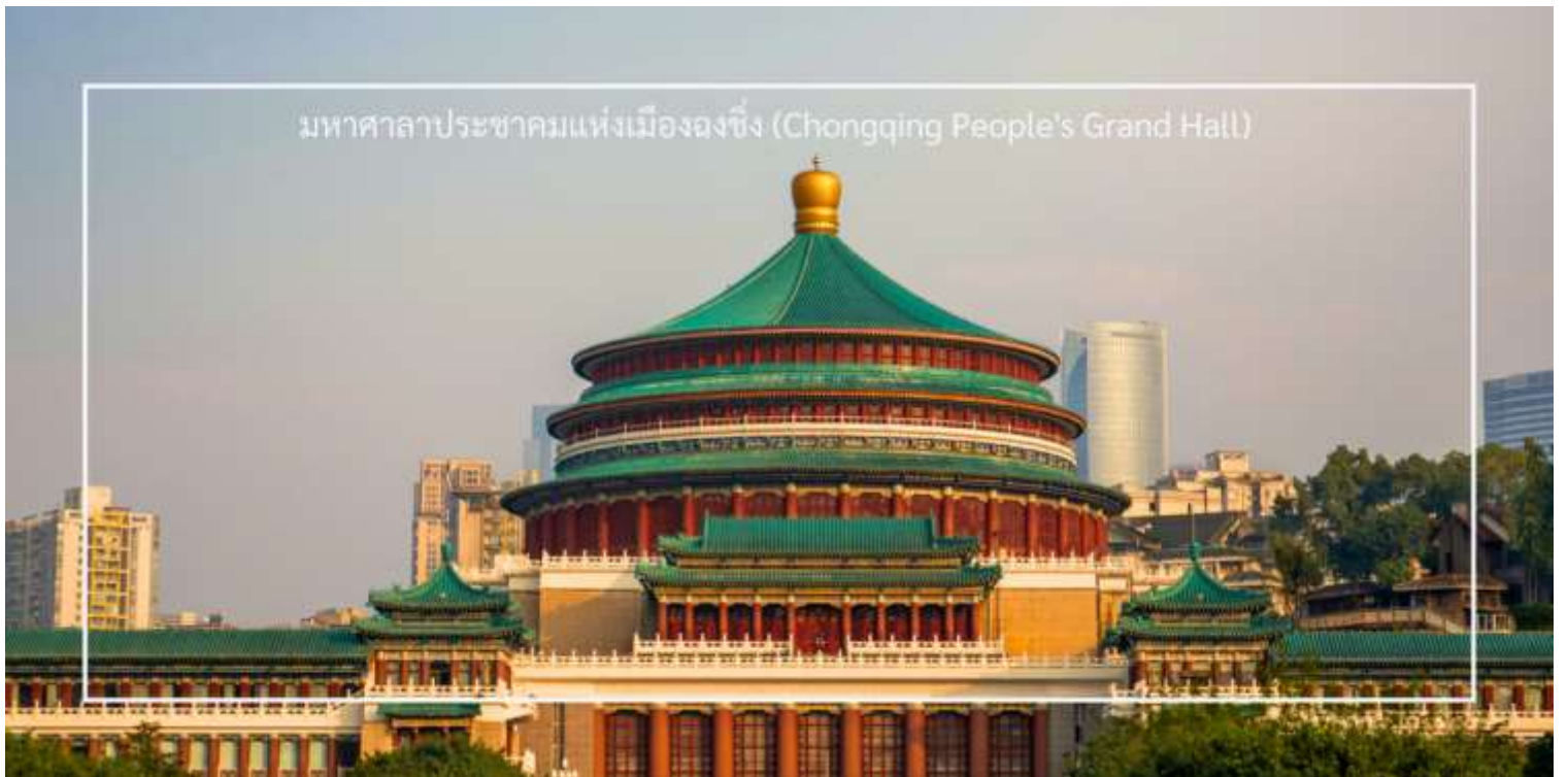
มหาศาลาประชาชนแห่งเมืองจงชิ่ง (Chongqing People's Grand Hall)

นำท่านเที่ยวชม มหาศาลาประชาชนแห่งเมืองจงชิ่ง (Chongqing People's Grand Hall) เป็นหนึ่งในสัญลักษณ์สำคัญของเมืองจงชิ่ง สถานที่นี้มีความสวยงามและโดดเด่นในด้านสถาปัตยกรรม โดยมีการออกแบบในสไตล์จีนดั้งเดิมที่ผสมผสานกับสถาปัตยกรรมสมัยใหม่ อาคารมีลักษณะเป็นรูปทรงกลมที่มีหลังคาสูงและมีสีสดใส โดยมีการตกแต่งด้วยลวดลายจีนที่สวยงาม ซึ่งทำให้เป็นที่น่าสนใจในการถ่ายภาพ มหาศาลาประชาชนแห่งนี้ใช้เป็นสถานที่จัดการประชุม ตลอดจนกิจกรรมทางวัฒนธรรม เช่น คอนเสิร์ต การแสดงศิลปะ และพิธีการต่างๆ