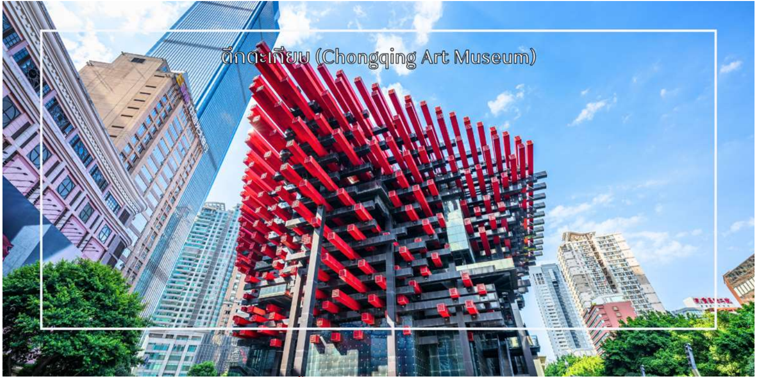
ตึกตะเกียบ (Chongqing Art Museum)

จากนั้นนำท่านชม ตึกไควชิงโหล (Kuaiqinglou) 22 ชั้น ตึกสุดแปลกเดินจากชั้น 1 กลายเป็นชั้นที่ 22 แลนด์มาร์กสำคัญที่ตั้งตระหง่านอยู่ใจกลางเมืองฉงชิ่ง โดดเด่นด้วยสถาปัตยกรรมสูงส่งที่ผสมผสานความทันสมัยเข้ากับเสน่ห์ของวัฒนธรรมท้องถิ่นอย่างลงตัว จากชั้นบนสุดของตึกสูง 22 ชั้นแห่งนี้ ท่านจะได้ชมทัศนียภาพแบบพาโนรามา 360 องศา ทั้งแม่น้ำแยงซีที่ทอดยาวคดโค้งและภาพเมืองฉงชิ่ง จากนั้นแวะถ่ายรูปและสัมผัสความสวยงามของ ตึกตะเกียบ (Chongqing Art Museum) แลนด์มาร์กสุดแปลกตาใจกลางเมือง ที่ออกแบบอาคารให้มีลักษณะคล้ายตะเกียบ ยักษ์สีแดง-ดำซ้อนกันอย่างโดดเด่น อาคารแห่งนี้เป็นที่ศูนย์จัดแสดงศิลปะร่วมสมัยและจุดถ่ายภาพยอดนิยมของนักท่องเที่ยว ด้วยดีไซน์ทันสมัยและเอกลักษณ์เฉพาะตัว ทำให้ที่นี่กลายเป็นหนึ่งในสถานที่ที่ต้องมาเยือน