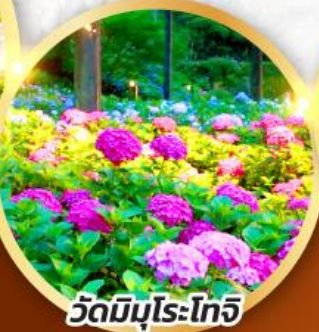
วัดมิบุโระโทจิ