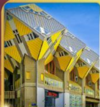
บ้านลูกเต่า โลกักคูมูส

“ล่องเรือหลังคากระจก” ชมกรุงอัมสเตอร์ดัม