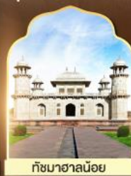
ถ้ำมาชาน้อย