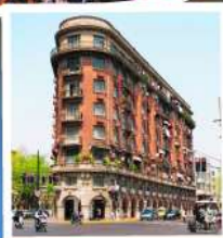
ถนนอุคิง