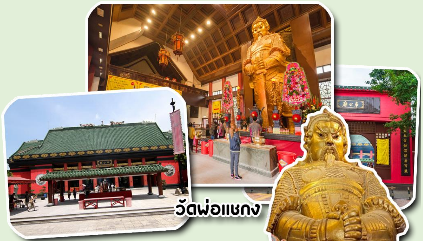
วัดพ่อแซงก

นำท่านเดินทางสู่ วัดแขก วัดที่ชาวฮ่องกงให้ความเลื่อมใสศรัทธามาเนิ่นนานสร้างขึ้นเพื่อระลึกถึงตำนาน นักรบแห่งราชวงศ์ซ่ง เทพเจ้าแซงก แม่ทัพปราบศึกที่กล้าหาญ ในกองทัพของท่านยามที่ออกรบเพื่อต้านข้าศึกศัตรูทุก ทิศทางทุกครั้งท่านจะใช้สัญลักษณ์รูปกังหัน 4 ใบพัด ติดไว้ด้านหลังรถศึกนำขบวนในกองทัพของท่าน ซึ่งท่านมีความ เชื่อว่าเมื่อพกพาสัญลักษณ์รูปกังหันนี้ไปณที่ใดๆกังหันนี้จะช่วยเสริมสิริมงคลนำพาแต่ความโชคดีมีอำนาจเข้มแข็งเสริม กำลังใจให้แก่กองทัพของท่านชื่อเสียงในการนำทัพสู้ศึกของท่านจึงเป็นตำนานมาจนทุกวันนี้