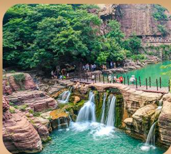
“อุทยานหยุนไท่ซาน”