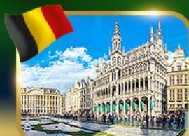
จัตุรัสกรอนด์ ปลาซ บรีซเซลส์