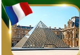
พีพีทกันที่ลูฟวร์ ปารีส