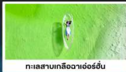
ทะเลสาบเกลือฉาเอ๋อร์อัน