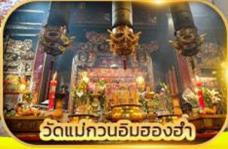
วัดแม่กวนอิมสองอ่า