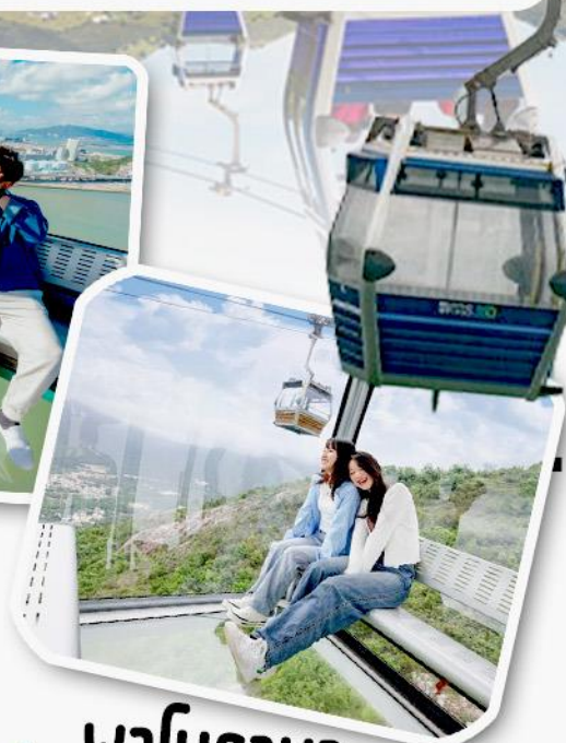
พานิราม่า