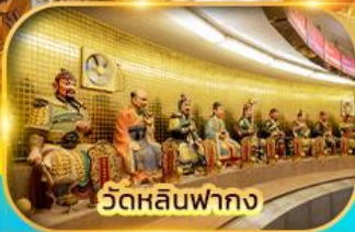
วัดหลินฟาถง