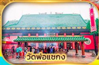
วัดพ่อแชกง