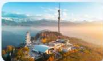
Kok Tobe Hill