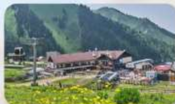
Shymbulak Ski Resort