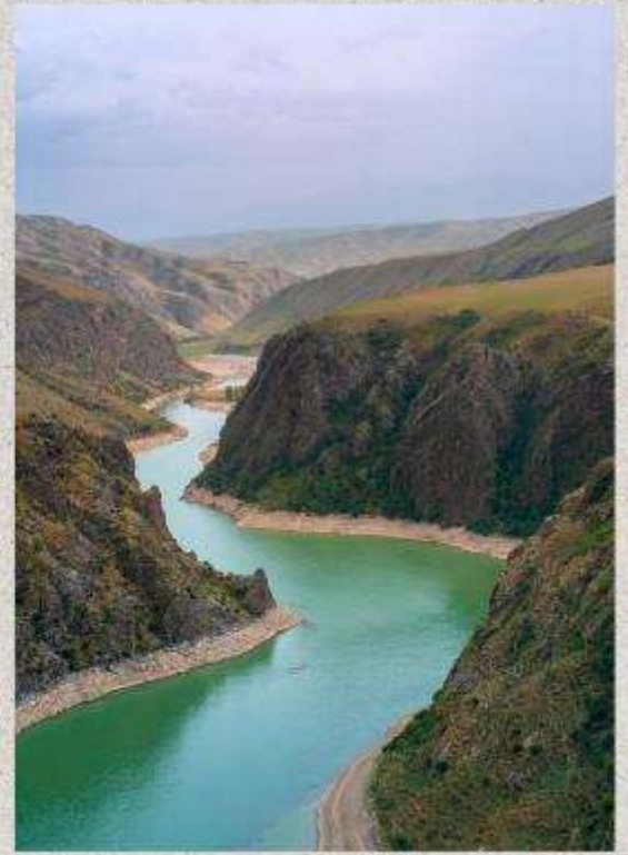
แกรนด์แคนยอนคุโคซู