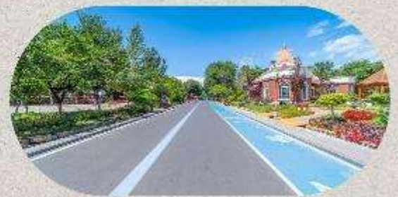
หมู่บ้านโบราณอุยกูร์คาจันจี