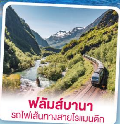
พลัมส์บานา รถไฟเส้นทางสายโรแมนติก