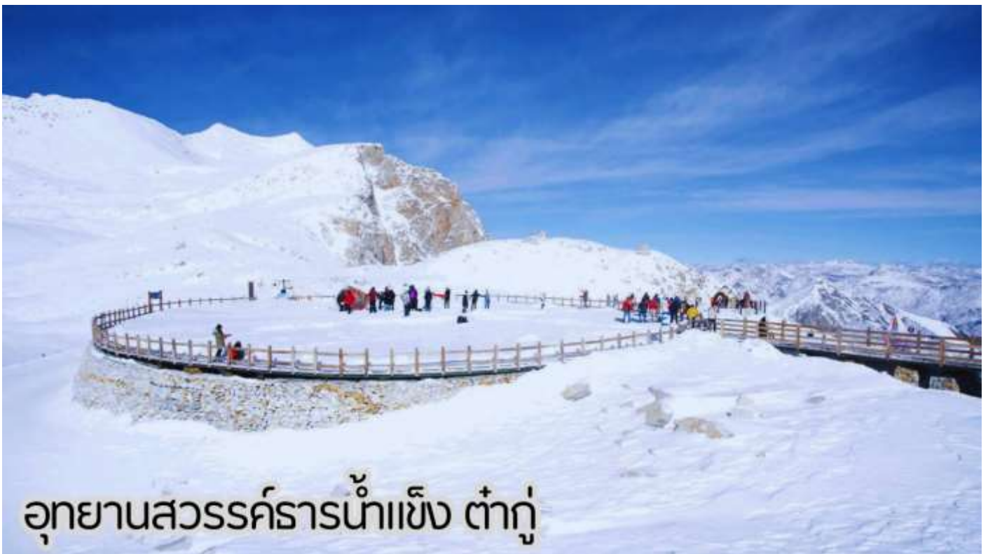
อุทยานสวรรค์ธารน้ำแข็ง ต่ากู่

นำท่านเดินทางสู่ อุทยานสวรรค์ภูผาหิมะการ์เซีย “ต่ากู่ปิงชว่น” ถือได้ว่าเป็นอุทยานสมบัติทางธรรมชาติที่ล้ำค่าของมณฑลเสฉวน ที่มีความงามไม่แพ้อุทยานและทะเลสาบใดใดบนโลกมนุษย์ อุทยานสวรรค์ภูผาหิมะการ์เซีย “ต่ากู่ปิงชว่น” ถูกค้นพบผ่านดาวเทียมเมื่อปี ค.ศ. 1992 โดยนักวิทยาศาสตร์ชาวญี่ปุ่น หลังจากได้ตรวจสอบพื้นที่จึงทราบว่าที่เป็นธารน้ำแข็งที่ตั้งอยู่ต่ำที่สุด ใหญ่ที่สุด และอายุน้อยที่สุดในโลก และยังคงตั้งอยู่ไม่ไกลจากตัวเมืองทำให้สามารถเดินทางไปท่องเที่ยวได้ง่าย ซึ่งคนในพื้นที่มีความเชื่อว่าภายในธารน้ำแข็งแห่งนี้มีเทพเจ้าศักดิ์สิทธิ์พิทักษ์อยู่ จึงทำให้ไม่มีใครสามารถพิชิตยอดเขาแห่งนี้ได้ จุดที่สูงที่สุดมีความสูงจากระดับน้ำทะเลประมาณ 5,286 เมตรเป็นภูเขาน้ำแข็งที่ศักดิ์สิทธิ์ ชาวบ้านเชื่อว่ามีเทพเจ้าพิทักษ์ภูเขานี้ทำให้ภูเขานี้ยังมีคนมีใครพิชิตยอดเขาได้