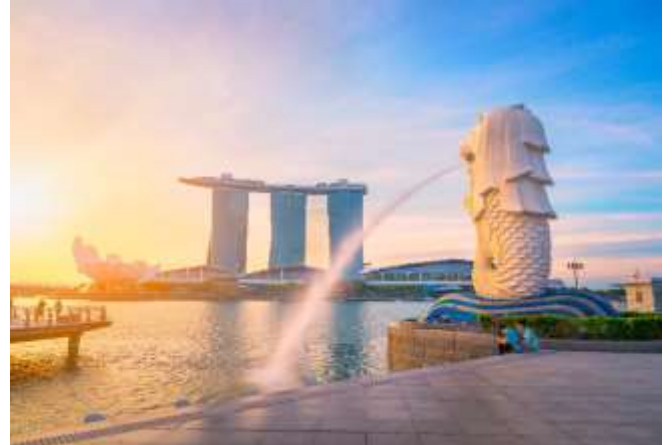
นำท่าน ชมเมือง สิงคโปร์ นำท่าน ถ่ายรูปคู่กับ เมอร์ไลออน

ไลออน สัญลักษณ์ของประเทศสิงคโปร์ โดยรูปปั้นครึ่งสิงโตครึ่งปลาที่หันหน้าออกทางอ่าวมารินา มีทัศนียภาพที่สวยงาม โดยมีฉากด้านหลังเป็น “โรงละครเอสเพลนาท” ซึ่งโดดเด่นด้วยสถาปัตยกรรมคล้ายหนามทุเรียน ชมถนนอลิซาเบธวอล์ค ซึ่งเป็นจุดชมวิวยามเย็นน้ำสิงคโปร์